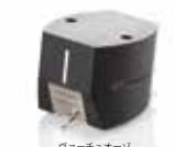
ヴァーチュオーゾ

●重量: 8.4g ●スタイラス: HD ダイヤモンド ●Ch. セパレーション: >28dB ●カンチレバー: ボロン ●周波数特性: 20Hz-20kHz ●Ch. バランス: <0.3dB ●出力: 3.6mV ●適性負荷: 47kΩ ●インダクタンス: 0.4H ●ボディ: エボニー ●針圧: 2.2g (1.9~2.5g)