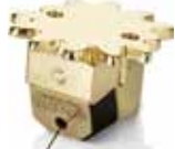
ゴールドフィンガー ステイトメント